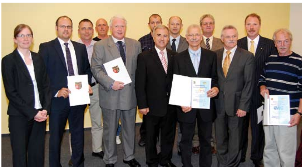
Auszeichnung der 2. Ökoprofit-Runde, Landkreis Mainz-Bingen 2011

Die Betriebe werden an acht moderierten Workshops teilnehmen und in einen intensiven Erfahrungsaustausch mit allen anderen beteiligten Firmen aus dem Landkreis treten. Außerdem erhalten die Firmen eine gezielte Vor-Ort-Beratung durch die vom Landkreis hierfür beauftragte Firma Arqum aus Frankfurt. Als Ziel wird ein speziell auf das Unternehmen bezogenes Umweltprogramm gemeinsam mit den Mitarbeitern erarbeitet,