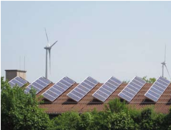
Regenerative Energie aus Wind und Sonne

Ob Windräder schön sind und die Landschaft schmücken, darüber lässt sich stundenlang streiten. Dass aber regenerative Energien und schadstofffreie Energieproduktion sinnvoller sind als die Steigerung klimaschädlicher Kohlendioxid-Emissionen, darüber sind sich inzwischen Wissenschaft, Politik und die Öffentlichkeit weitestgehend einig. Also wird auch fast jeder zustimmen, dass eine „dicke grüne Null“ bei der Kohlendioxid-Emission ein erstrebenswertes Ziel ist! Aber ist das auch erreichbar? Ist das mehr als ein frommer Wunsch? Und können gleich drei Landkreise gemeinsam das ehrgeizige Ziel erreichen?