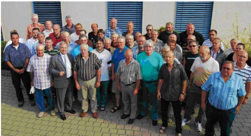
Die Wertstoffhofbetreuer des AWB, hier zu Besuch bei Landrat Claus Schick, stehen Ihnen bei Ihrem Besuch auf den Wertstoffhöfen beratend und mit Antworten auf Ihre Fragen zur Seite.